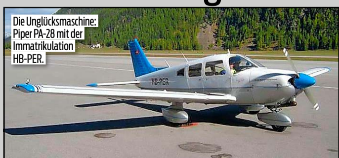
Die Unglücksmaschine: Piper PA-28 mit der Immatriculation HB-PER.

Samedan GR – Die Gruppe war mit einer Piper Archer II der Motorfluggruppe Oberengadin unterwegs. Bei der einmotorigen Maschine, die vier Sitzplätze hat, handelt es sich um eine Piper PA-28 mit der Immatriculation HB-PER. Sie ist letztmals im Juli 2017 gewartet worden. Der Flieger gehört zu den meistgebauten Flugzeugentypen überhaupt: Über 510 000 Exemplare wurden laut Herstellerangaben weltweit vom Typ gebaut. Aufgrund der Flugeigenschaften sei die Maschine sehr beliebt, wird gerne als