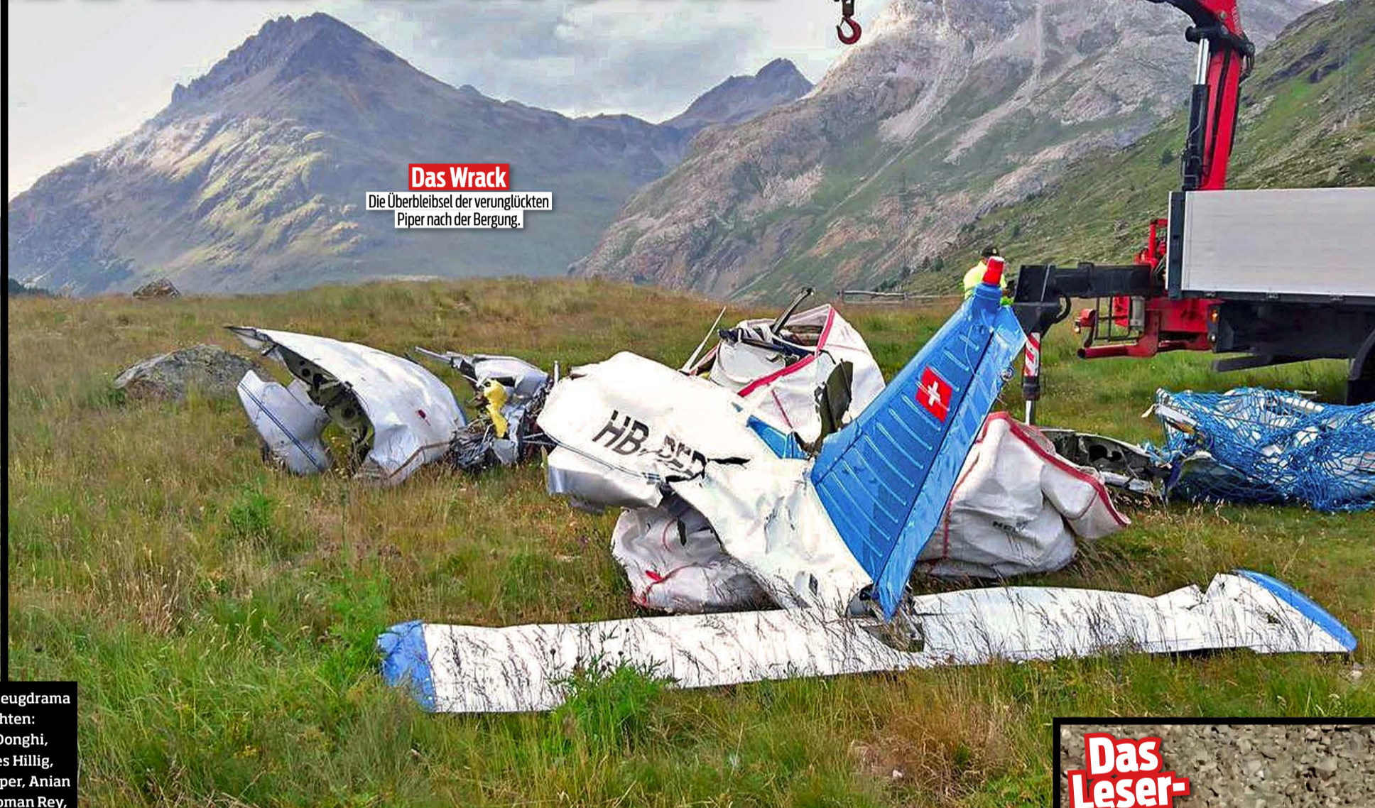
Das Wrack Die Überbleibsel der verunglückten Piper nach der Bergung.

Ein BLICK-Leserreporter hat das Flugzeugwrack und die Rettungsmassnahmen aus der Seilbahngondel der