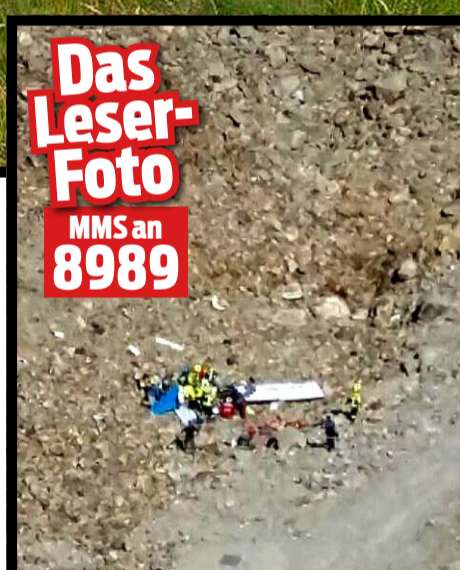
Das Leserfoto MMS an 8989