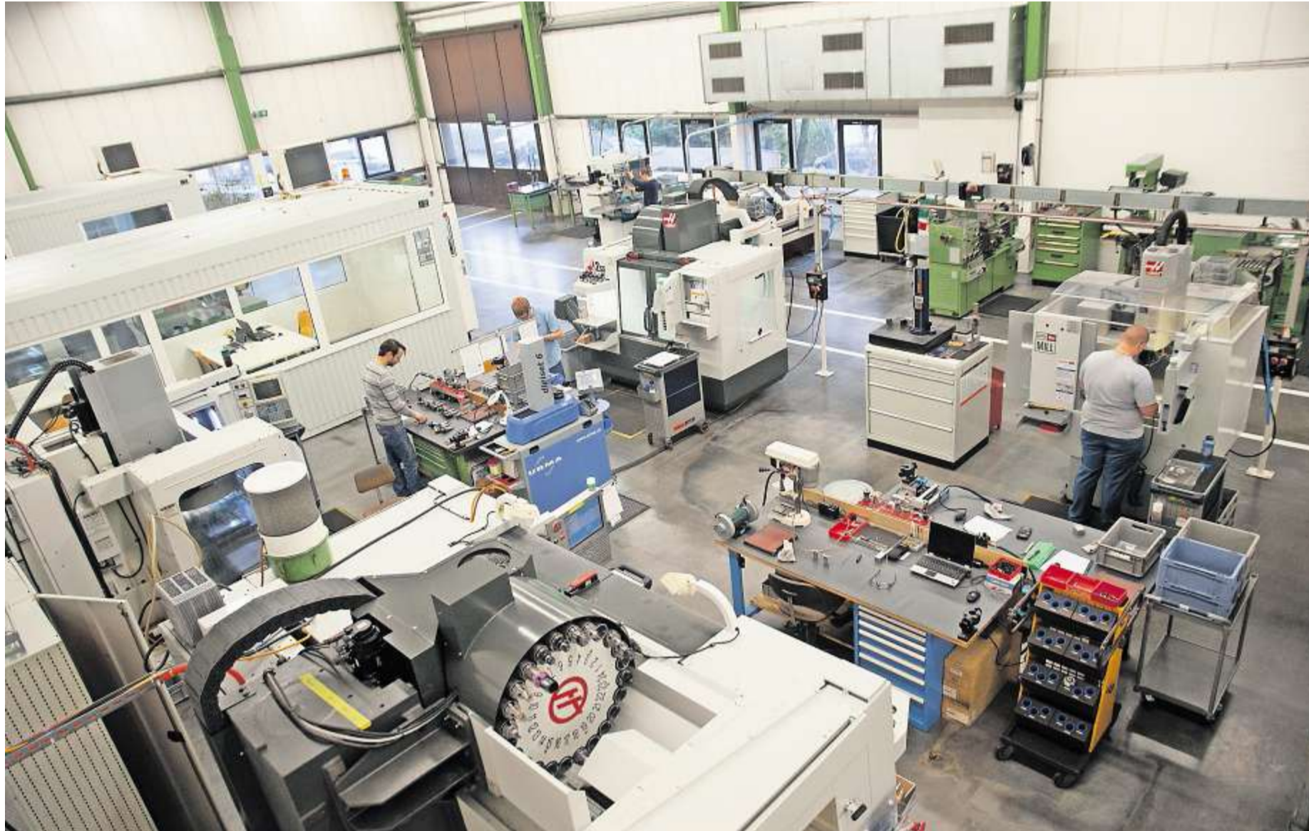
Von Horgen aus mit Klemmen, Schellen und Ringen die Welt erobert: In den gut 70 Jahren ihres Bestehens hat sich die Oetiker-Gruppe ganz nach oben gearbeitet.